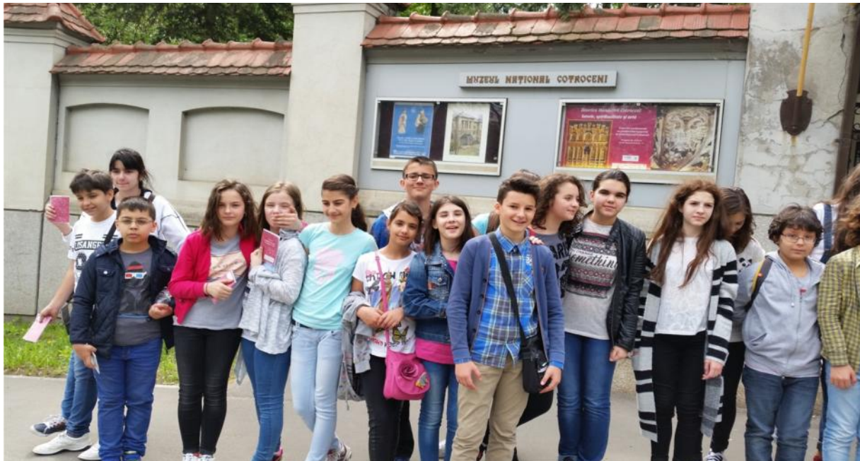
Muzeul Na ional Militar